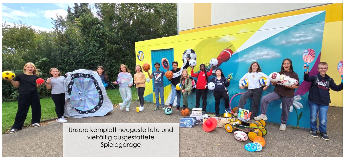
Unsere komplett neugestaltete und vielfältig ausgestattete Spielegarage